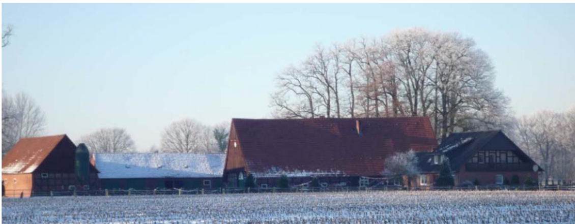
Abb. 1: Hof Kötter im Ladberger Ortsteil Wester. In der Mitte sieht man das Geburtshaus von Friedrich Kötter.

Die Menschen lebten im Tecklenburger Land bis ins 19. Jh. hauptsächlich von der Landwirtschaft, die aber wegen der schlechten Böden nicht ertragreich war. Viele Menschen litten aufgrund der schlechten Erträge und der steigenden Bevölkerungszahlen Hunger, sodass ab ca. 1830 eine große Auswanderungswelle einsetzte, die die Bevölkerung von 2 676 im Jahre 1831 auf 1 865 Einwohner im Jahre 1872 schrumpfen ließ. 2 Vor allem in sehr großen Familien war es nichts Ungewöhnliches, wenn alle Kinder bis auf den Hoferben und ein weiteres Geschwisterteil auswanderten. Das Ziel fast all dieser Auswanderer war Amerika, von dem man viel gehört hatte und das eine Aussicht auf ein besseres Leben bot. Vor allem zu Beginn der Auswanderungswelle zogen Agenten 3 durch das Tecklenburger Land, die für die „Neue Welt“ warben und viele Menschen überzeugen konnten.